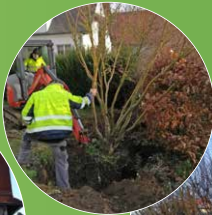
Réutilisation du laurier