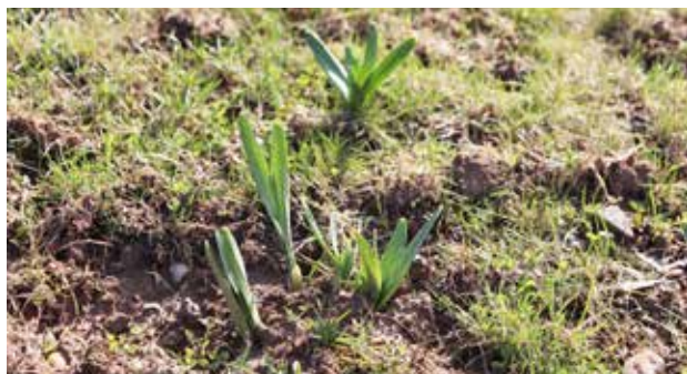
Les premiers bulbes de fleurs vivaces apparaissent

Au niveau des espaces verts, les services techniques ont travaillé « d'arrache pied » tout l'hiver pour embellir la commune à l'arrivée du printemps. En partenariat avec le promoteur de la future Résidence Services Séniors dont les premiers travaux de déconstruction devraient commencer en mai, les services techniques de la commune ont récupéré jusqu'à 250 plants vivaces et quelques 50 gros arbres dont un magnifique Figuier, un Magnolia Stellata, Erable du Japon, Vibornium, Hydrangea (famille des Hortensias), du Lilas, du Laurier persistant, de la Spiray, .... Ils ont été replantés pour compléter et finir d'aménager les espaces verts de la commune : les massifs devant la Mairie, l'habillage du regard de l'école maternelle, le pourtour du toboggan du parc, autour des noues et du regard de la pompe du puits, etc. (voir les photos en dernière page de couverture).