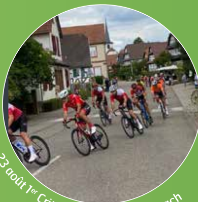
23 août 1 er Critérium cycliste à Seebach