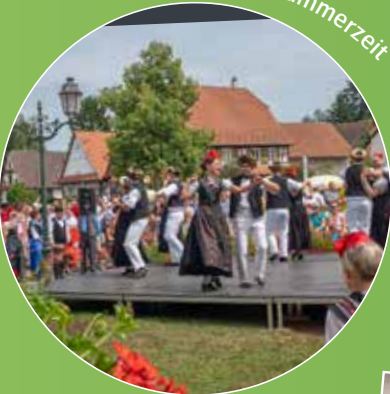
19 et 20 juillet - Summerzeit