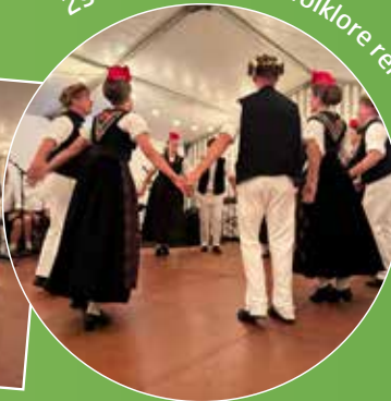
29 août - Quand le folklore rencontre le vignoble