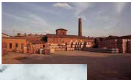
Tuilerie de Riedseltz