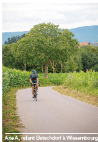
Axe A, reliant Betschdorf à Wissembourg

Ces travaux ambitieux qui représentent un investissement conséquent, avec un coût de 2,8 millions d'euros pour l'Axe A et 2,2 millions d'euros pour l'Axe B, soutenus à hauteur de 50% par la Collectivité.