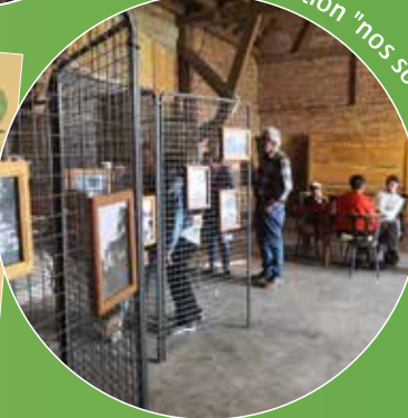
22 mars - exposition "nos souvenirs oubliés"