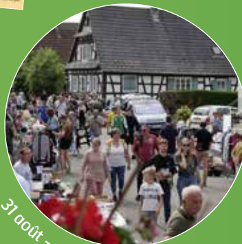
31 août - vide grenier