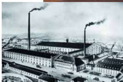
Tuilerie de Seltz