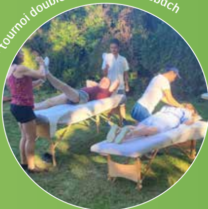
3 au 6 juillet - tournoi double Tennis Club Seebach